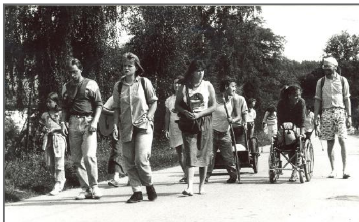
PREHISTORIE AKADEMIE — „PUŤÁKY“ JEDLIČKOVA ÚSTAVU

Od roku 1997 byly každoročně otevřeny dva studijní kruhy, denní a dálkový. Kruhy denního studia vzniklé v letech 1998 a 1999 se nepodařilo udržet do konce studia a studenti, kteří chtěli z těchto kruhů ve studiu pokračovat, se připojili k nižším ročníkům. Dálkové studium postupem času vykrystalizovalo v jednotřídní pětileté studium.