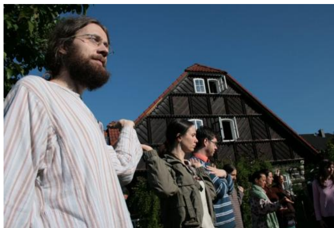
RANNÍ DIVADLO V NOVÉ VSI