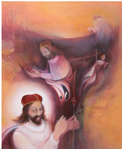
UKÁZKY VÝTVARNÝCH PRÁČÍ STUDENTŮ