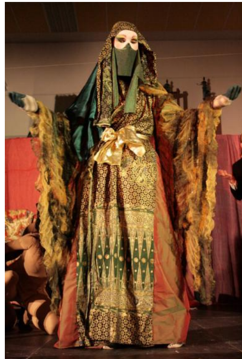
ZLO V PŘSTROJENÍ, KEJKLIŘSKÁ POHÁDKA