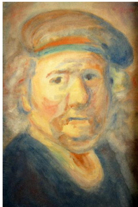
STUDIUM TEMPERAMENTŮ — FLEGMATIK

Nový model dálkového studia, který začíná orientačním rokem a může dále pokračovat k plnému studiu, se osvědčil. Osvědčilo se i jmenování asistentů studia pro jednotlivé ročníky či studijní kruhy.