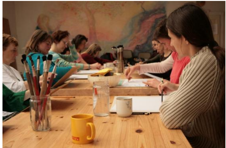
VÝUKA V AKADEMII - ARTETERAPIE

Akademie vznikla jako samostatná škola, jejímž cílem je výchova v oblasti léčebné pedagogiky a sociálně umělecké terapie a vlastní prožitek v oblasti sociální problematiky v nejširším slova smyslu. Studium je zaměřeno na probuzení vlastního živého myšlení, širokého soucítění a rozvíjí tvůrčí schopnosti člověka. Opírá se o trojčlenný pohled na člověka jako bytost fyzickou, duševní a duchovní.