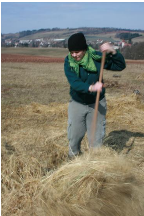
PRÁCE V NOVÉ VSI

Po celý školní rok zde probíhaly týdenní praxe studentů Akademie. Z finančního daru AG Stiftung byl Nadací Tabor zakoupen druhý dům v Nové Vsi. Hledáme prostředky na jeho rekonstrukci.