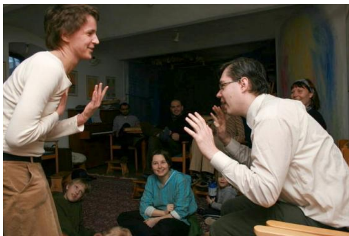
VÝUKA V AKADEMII - DRAMATERAPIE

Studenti Akademie jsou během celého studia vedeni především k poznání a rozvíjení vlastní osobnosti. Cílem je posílit individualitu jednotlivců tak, aby dokázali vědomě pracovat s konflikty vlastními i s konflikty ve společnostech. Studenti jsou vedeni k tomu, aby do sociální oblasti vstupovali vědomě a pomáhali vytvářet různá společenství, která mohou dát prostor k vyjádření každé jednotlivé osobnosti, byť různým způsobem handicapované.